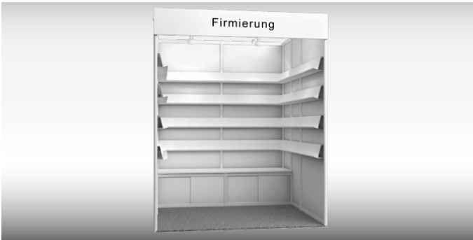
Beispiel-Abbildung: 4 m 2 Reihenstand | Example illustration: 4 m 2 row stand