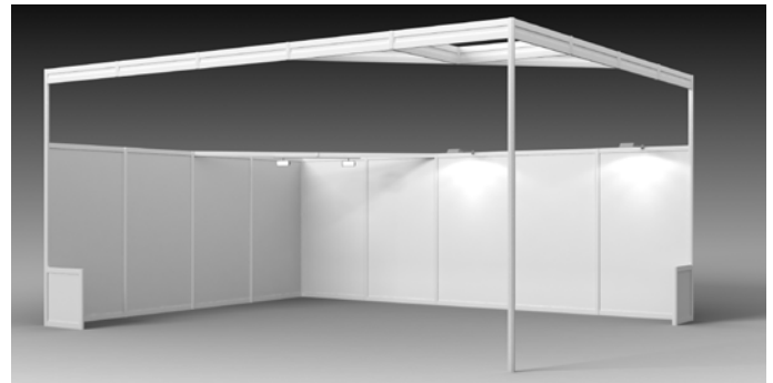
Beispiel: 20-m²-Komplettstand „Standard“ mit Aufstockung Example: 20 m² Complete stand “Standard” with extra high