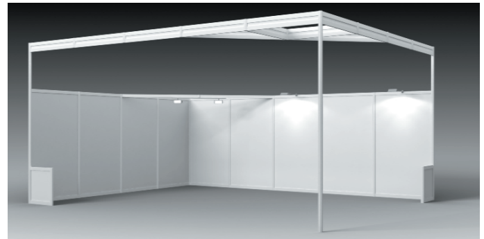
Beispiel: 20-m²-Komplettstand „Standard“ mit Aufstockung Example: 20 m² Complete stand “Standard” with extra high